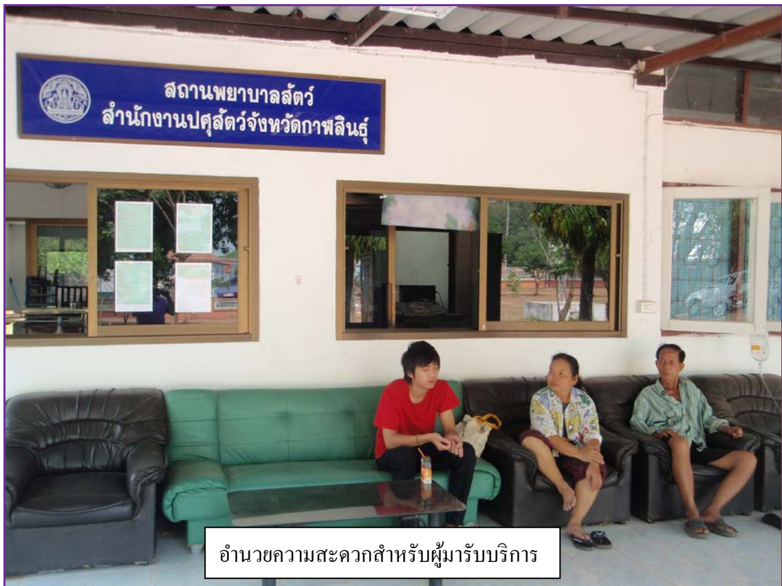
อำนาจความสะดวกสำหรับผู้มารับบริการ